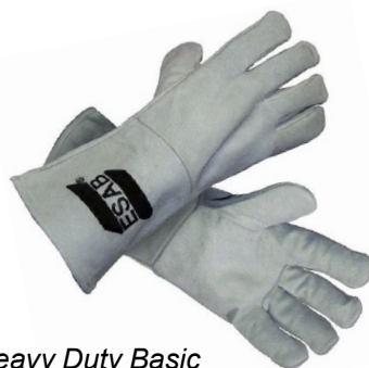
Heavy Duty Basic

Az MIG/MAG-/MMA hegesztéshez készült kesztyűknek a legmostohább körülmények között is maximális teljesítményt kell nyújtaniuk. Ezek a strapabíró kesztyűk hatékonyan védik viselőjüket, ugyanakkor puha, rugalmas viseletet nyújtanak. Akár csak időnként hegeszt, akár teljes munkaidős szakember, az ESAB nagy igénybevételre tervezett, MIG/MAG-/MMA hegesztéshez készült kesztyűi minden körülmények között megóvják a kezét.