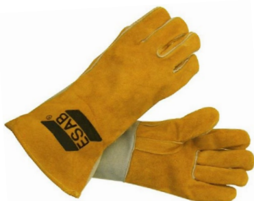
Heavy Duty Regular