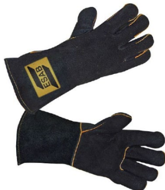
Heavy Duty Black