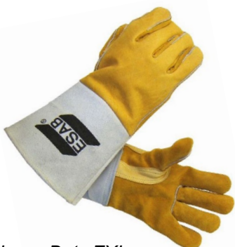
Heavy Duty EXL