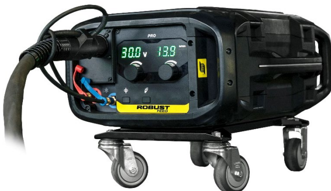
Rädersatz mit Vorschub horizontal oder vertikal einsetzbar

Weitere Informationen erhalten Sie unter esab.com .