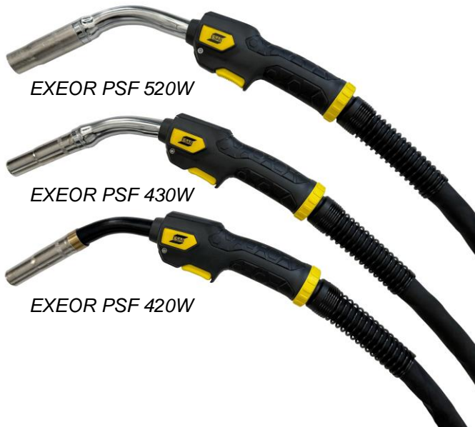
EXEOR PSF 520W