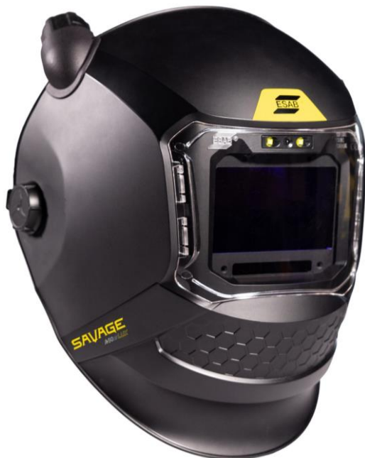
SAVAGE A50 Air LUX