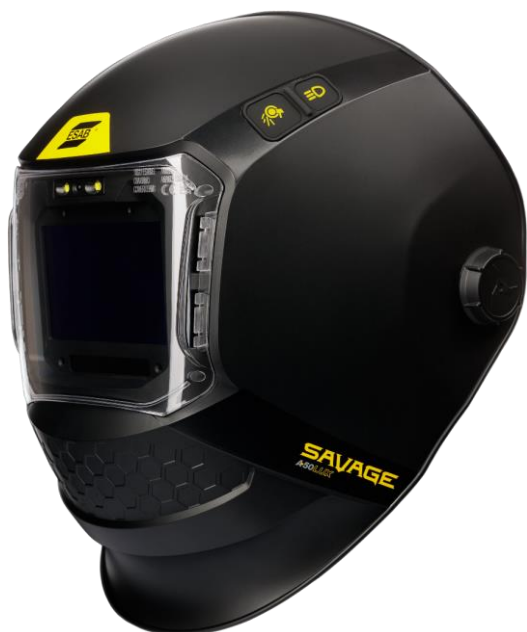
SAVAGE A50 LUX