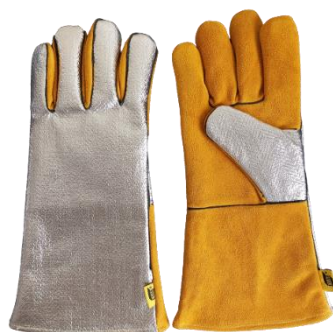
Nagy igénybevételre tervezett, alumíniumbevonatú

Prémium minőségű anyagokból készített, továbbfejlesztett funkciókkal rendelkező, professzionális, nagy igénybevételre készült (heavy-duty – HD) MIG/MAG-hegesztőkesztyűk/MMA hegesztőkesztyűk széles választéka. Az egyszerű, alkalmankénti használatra szánt, hasított bőrből készült, elektródás hegesztéshez használható MMA-hegesztőkesztyűtől (ilyen például az M1050), egészen a prémium minőségű, egész nap viselhető MIG/MAG-kesztyűkig (ilyen például az M3050), az ESAB nagy igénybevételre készült termékcsaládj a hegesztési védelem minden szintjére kiterjed.