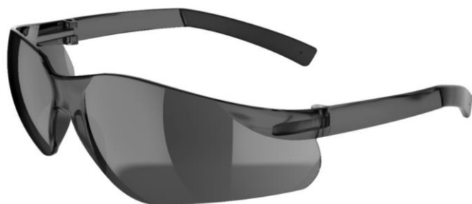
WeldOps SE-200 víztiszta, szürke