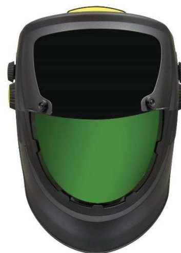
Nagy belső csiszolólcse

További információért látogasson el az esab.com weboldalra.