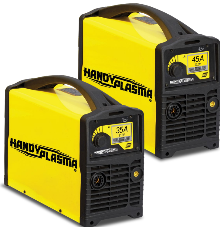
HandyPlasma 35i / 45i

Kézi, könnyű és hordozható áramforrás plazmavágáshoz, 220 V-os, 50/60 Hz-es egyfázisú tápegységgel.