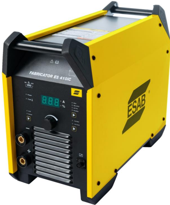
Fabricator ES 410iC