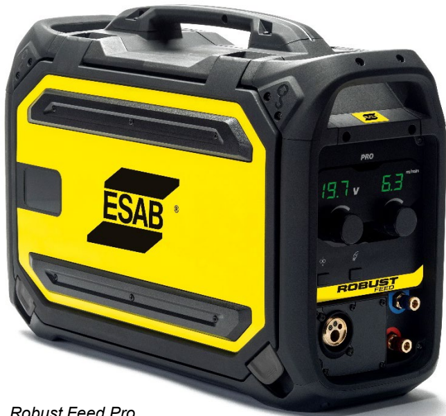
Robust Feed Pro

A Robust Feed ergonomikus, robusztus és zárt kialakításával ideális partner, ha a hordozhatóság és a tartósság kulcsfontosságú tényező. Új precíziós huzal – előtoló rendszerrel van felszerelve, amely elegendő teljesítményt biztosít akár 2,0 mm-es tömör huzal és 2,4 mm-es porfeltöltéses huzal előtolásához. A tengeri olajkitermelésben használatos változatok átfolyásmérővel és fűtéssel is rendelkeznek. A Robust Feed Pro használható a Warrior áramforrásokkal.